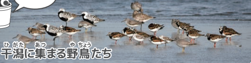
干潟に集まる野鳥たち

街地へと短いものまでさまざまです。このように定期的に決まった場所を行き来することを「渡り」と言います。